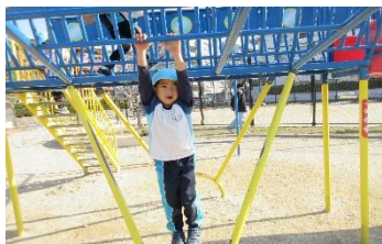
雲梯が上手になりました！