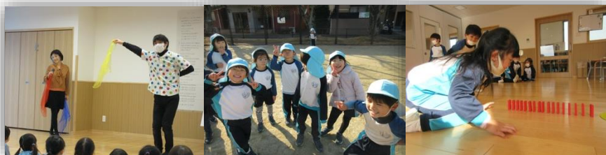
Happy Color コンサート

そして節分の次はあっという間にお遊戯会がやってきます。今年のこんぺき組は「マルーシカと12のつき」という絵本を題材にした劇、そして「にじ」を手話しながら合唱します。「マルーシカと12のつき」は心優しい少女が継母達にいじめられますが月の精に助けをもらい。最後は幸せになるというスロバキア民話です。最初に子ども達にこの絵本を読み聞かせした後、ほとんどの子がほかんとした表情を浮かべていました。一度で理解することは難しいので、繰り返し読みましたが、子ども達の表情はだんだん腑に落ちない表情に変わっていきました。その理由は、どうして最後に主人公の少女にいいことがたくさん起きるのかという事でした。少女はどんなふうに過ごしていたのか、継母達は少女にどんなことをしたのか、と一つ一つ結び付けてようやく納得できたようです。このオペレッタを通して、子ども達がなにか感じてくれることを楽しみにしています。一方、「にじ」の手話は1、2回ほどでほとんど覚えてしまい、私達を驚かせてくれました。どちらも本番まで楽しく練習に取り組んでいきたいと思えます。お楽しみに！