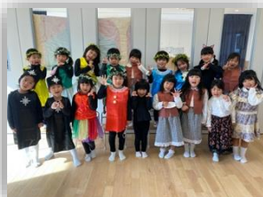
おゆうぎ会おつかれさま！