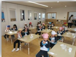
南南東を向いて恵方巻