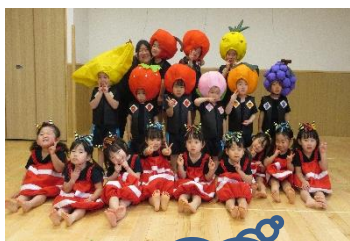
おゆうぎ会 頑張ったよ！

進級への期待をもちながら、びゃくぐん組での残りの時間を目一杯楽しみたいと思っています。