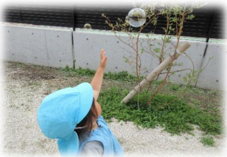
シャボン玉に興味津々の子どもたちです！

これからも子どもたちの興味が出る遊びを沢山し、暑さに負けず楽しく過ごしていきたいと思います。