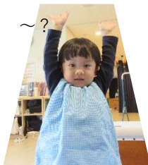
きめポーズ! カッコイイでしょ 〜?