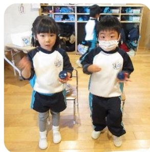
手話や楽器を学び、楽しみ ながら、音楽発表会の練習 をしています♪練習の成果 を發揮できますように！