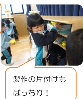
製作の片付けも ばっちり！