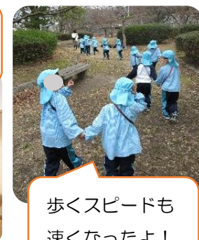
歩くスピードも 速くなったよ！