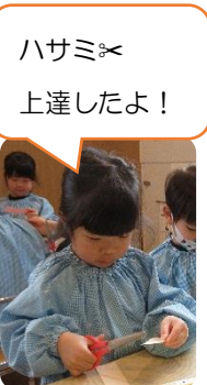
ハサミが 上達したよ！

1年間、明るく元気いっぱいなあさぎ組の子どもたちの成長を間近で見守らせていただきました。至らないところもあったかとは思いますが、保護者の方々とも子どもたちの姿を共有し、喜び合えることがとても嬉しかったです。4月から比べると段違いにお兄さんお姉さんになったあさぎ組。その成長した姿を音楽発表会で披露するのが楽しみです。残り1か月、あさぎ組らしく、楽しく元気に過ごしていきたいと思っておりますので、引き続きよろしくお願い致します。