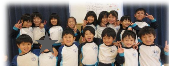
あたらしいほいくえんでもがんばってね☆