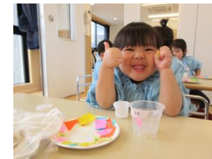
勤労感謝の日製作