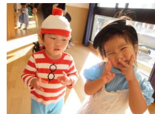
ハロウィンパーティー