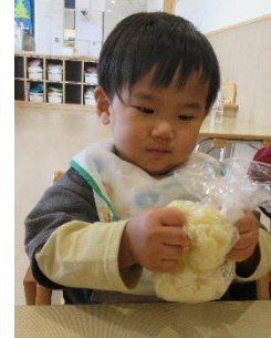
食育クッキング ~ポテトサラダ作り~