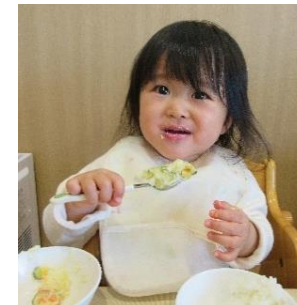
完成したサラダは給食でおいしくいただきました♪