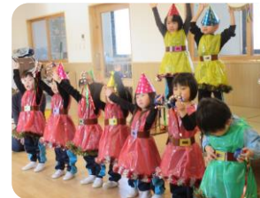
ポテトサラダ作ったよ!