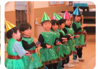
クリスマス会 頑張りました🎄🔔