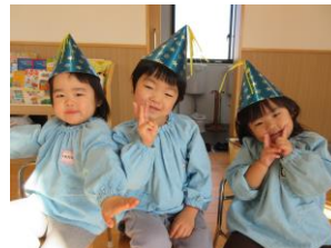
クリスマス会練習